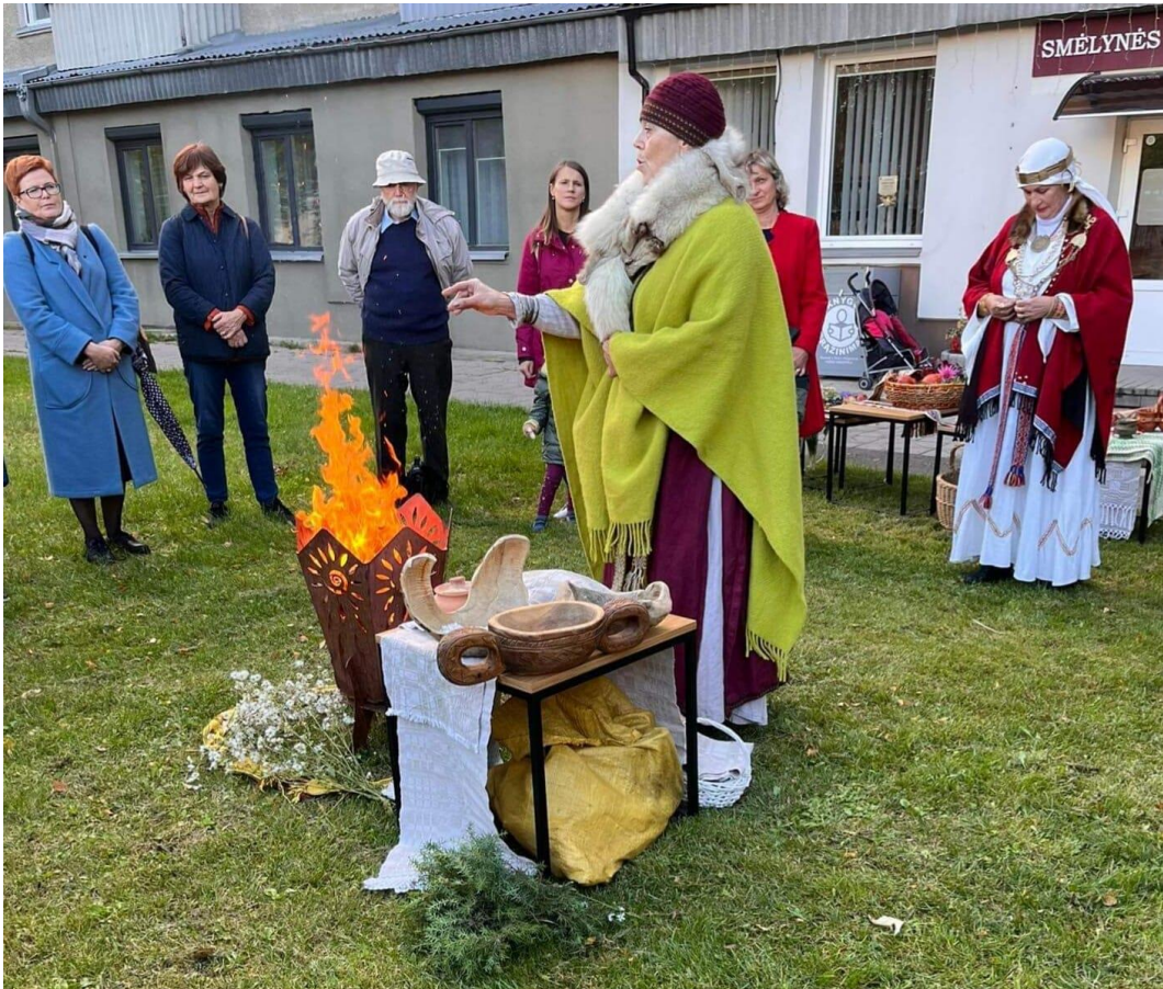
Kartu su Lietuvos moterų lygos Panevėžio skyriumi surengta Rudens lygiadienio šventė „Rudens lygė“