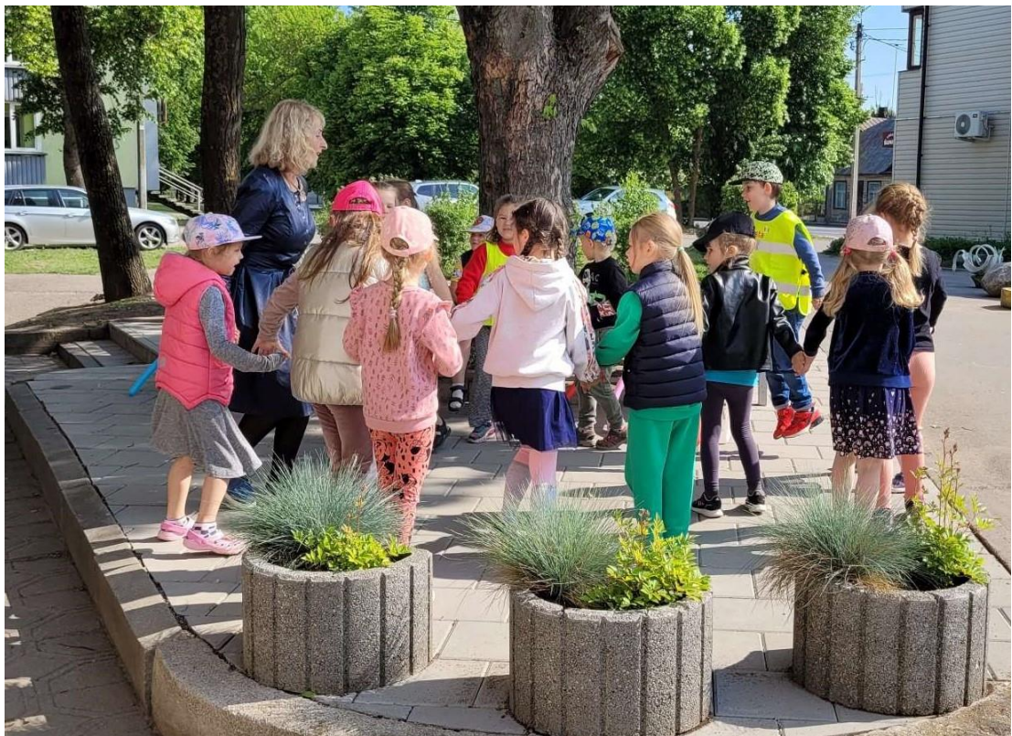
Kai pasėdėjus norisi ir pajudėti. Akimirka iš šventės „Vaikystės žiedai“ skaitymo skverelyje