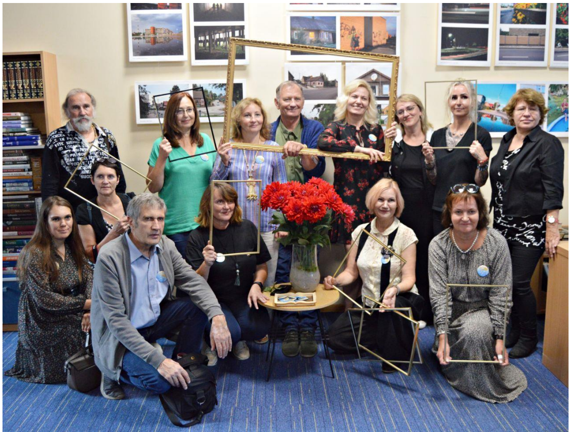
Parodos „Džiazas Senamiesčio gatvėje“ dalyviai – Panevėžio fotografų draugijos nariai. Trys viename: kūrybiškumas, profesionalumas ir bendruomeniškumas.