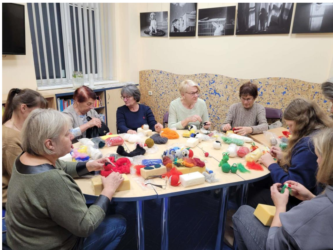
Kalėdinių žaislų vėlimo popietės Smėlynės bibliotekoje „Į pagalbą Kalėdų seneliui“

https://sekunde.lt/leidinys/sekunde/bibliotekoje-bankas-indelius-priimantis-sagomis/