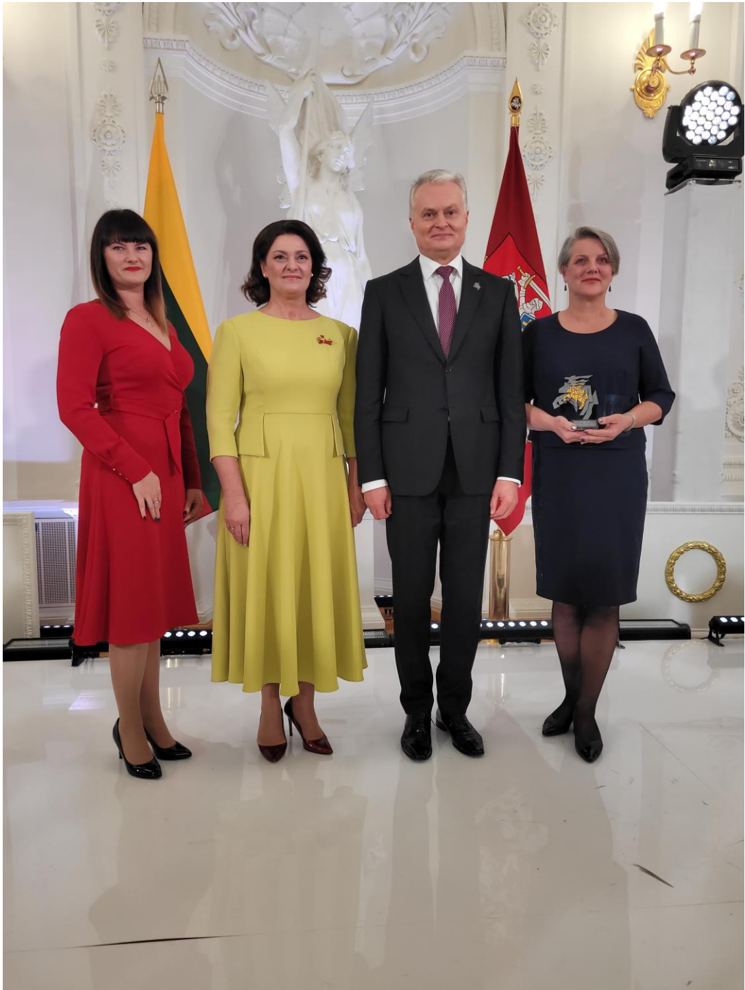
Iniciatyvos „Turtingi – dalindamiesi, laimingi – bendraudami“ laureatės Iškilingos „Lietuvos galia“ apdovanojimų įteikimo ceremonijos metu kartu su Lietuvos Respublikos Prezidentu Gitanu Nausėda ir pirmąja ponia Diana Nausėdiene