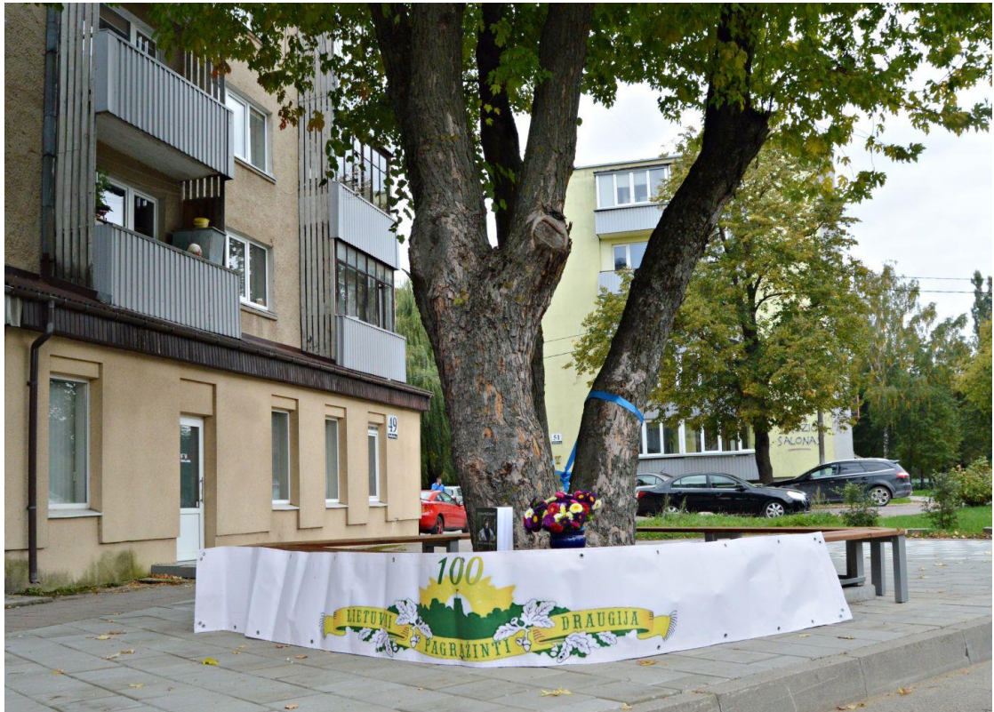
Minint Lietuvai pagražinti draugijos 100-tąjį jubiliejų, bibliotekos iniciatyva įrengtas skaitymo skverelis, o jame – suolelis, skirtas visų bendruomenės narių patogumui